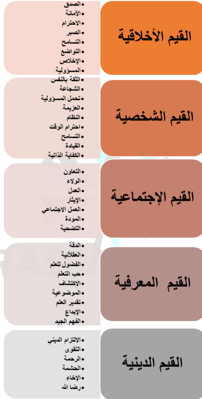
شكل 2: منظومة القيم المضمنة في الأنشطة الرياضية بجامعة السلطان قابوس